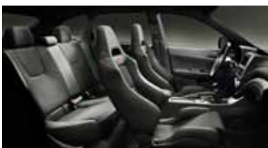
Toàn cảnh nội thất