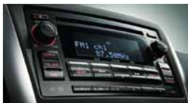
Hệ thống âm thanh