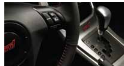
Hộp số tự động 5 cấp