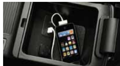
Ổ kết nối thiết bị ngoại vi AUX và cổng USB