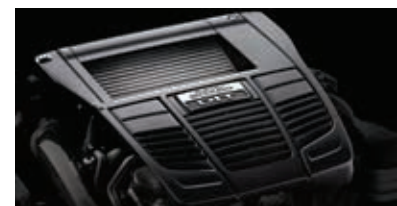
Động cơ mới 2.0 FA (DIT)