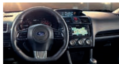
Tay lái thể thao bọc da