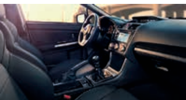
Ghế trước kiểu thể thao với đường chỉ đỏ