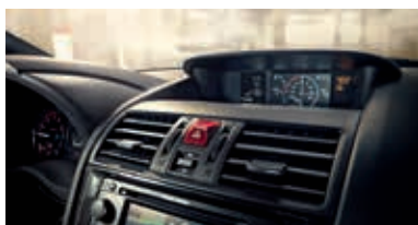
Màn hình đa chức năng cao cấp